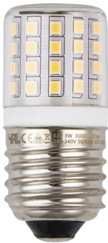
E27 Sockel-Layout E27 base layout

LED in tube form 27 x 60mm with 54 SMD LEDs, ideal as retrofit for railroad applications or industrial and port technology.